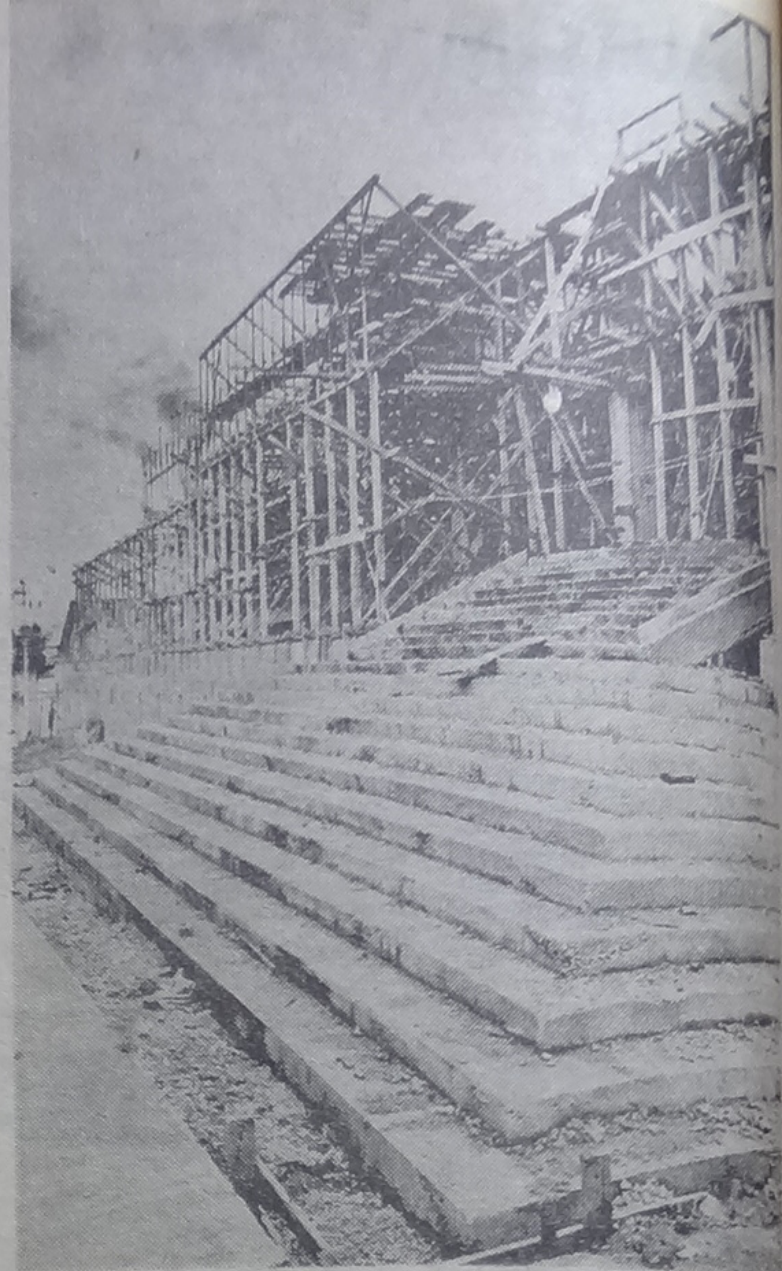
Así marchan los trabajos en la entrada principal del imponente edificio.