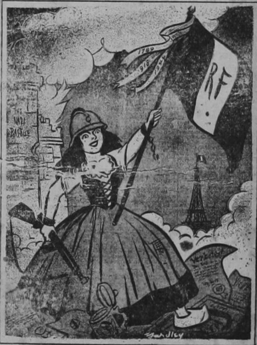
Le Jour de Gloire est arrivé!

WASHINGTON. — Notables personalidades de los Estados Unidos unieron sus palabras de entusiasmo al regocijo que siente hoy todo el mundo civilizado con motivo de la liberación de París, victoria aliada que es símbolo de la suerte final que espera a los agresores nazis. El Presidente Roosevelt, el Secretario de Estado Cordell Hull, el Secretario de Guerra Henry L. Stimson y Thomas Dewey, gobernador del estado de Nueva York, hicieron declaraciones sobre el rescate de la capital francesa, después de cuatro años de dominación nazi.