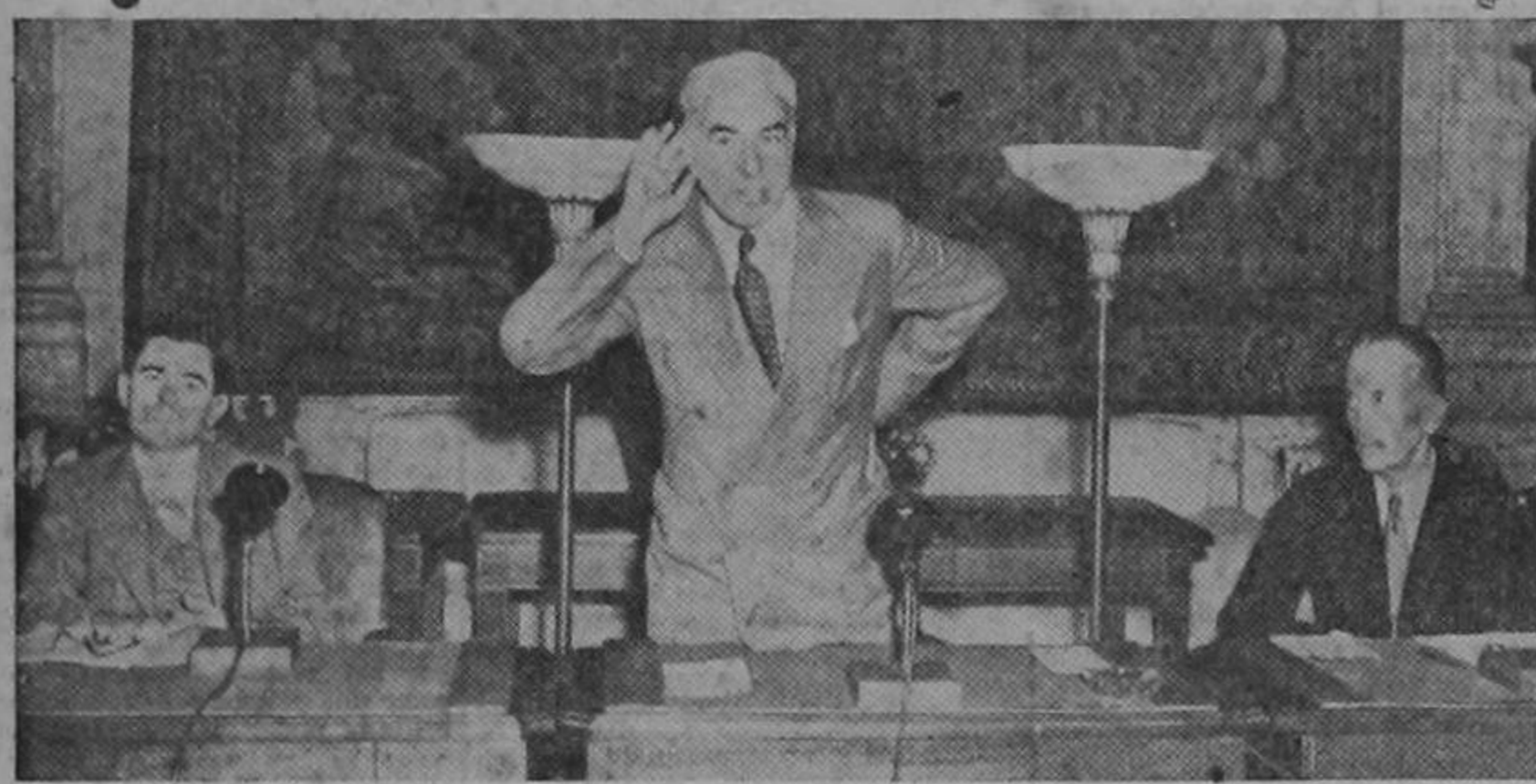
Conferencia con la prensa en Dumbarton Oaks: de izquierda a derecha, el Embajador Andrei Gromyko, jefe de la delegación rusa, el Vicesecretario de Estado de los Estados Unidos, Edward R. Stettinius, jefe de la delegación de los Estados Unidos, y Sir Alexander Cadogan, jefe de la delegación inglesa.

WASHINGTON.—Los representantes de los Estados Unidos, Inglaterra y Rusia están de acuerdo respecto a las bases generales del propuesto organismo internacional para mantener la paz y la seguridad después de la derrota total del Eje.