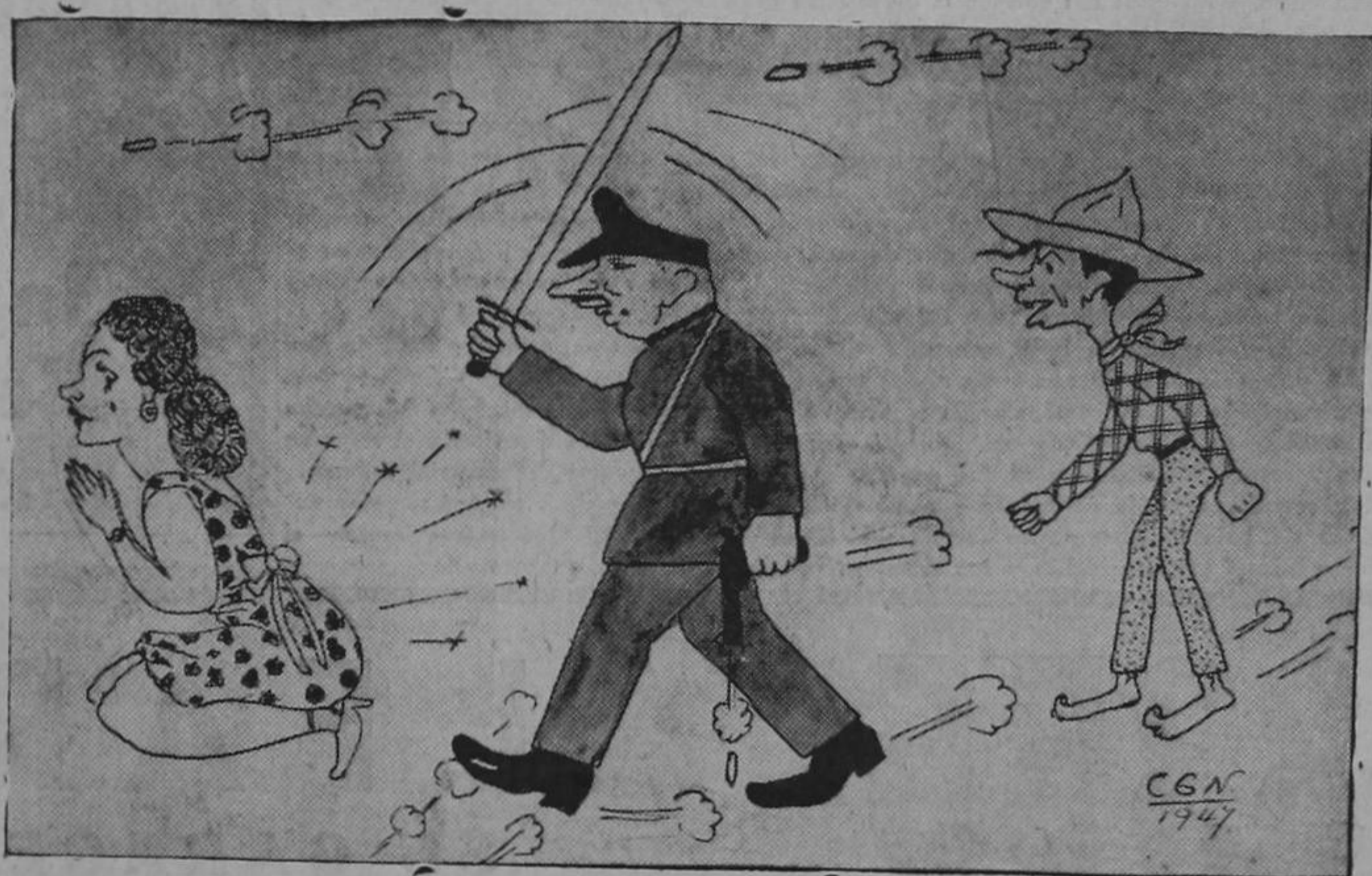
Estas son las libertades de que disfruta Costa Rica en la fecha de su "independencia" (FINAL DE LA MANIFESTACION DE DAMAS DEL 2 DE AGOSTO)

Hace muy poco tiempo, el comunismo emprendió una gran campaña para botar al Secretario de Fomento. En los periódicos, y en el Congreso, se oyeron — (Pasa a la Pág. CINCO)