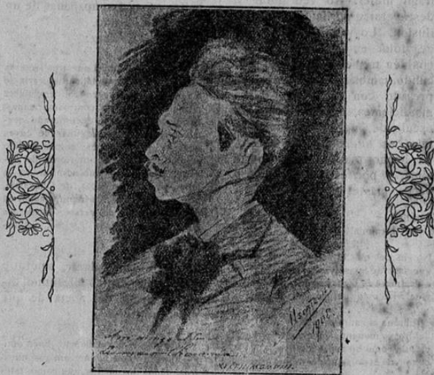
Caricatura de Lisímaco Chavarría

Al publicar hoy su caricatura — obra del exquisito artista colombiano Luis F. Uscátegui — sentimos un sincero goce, rindiéndole así el homenaje intelectual que bien se merece.