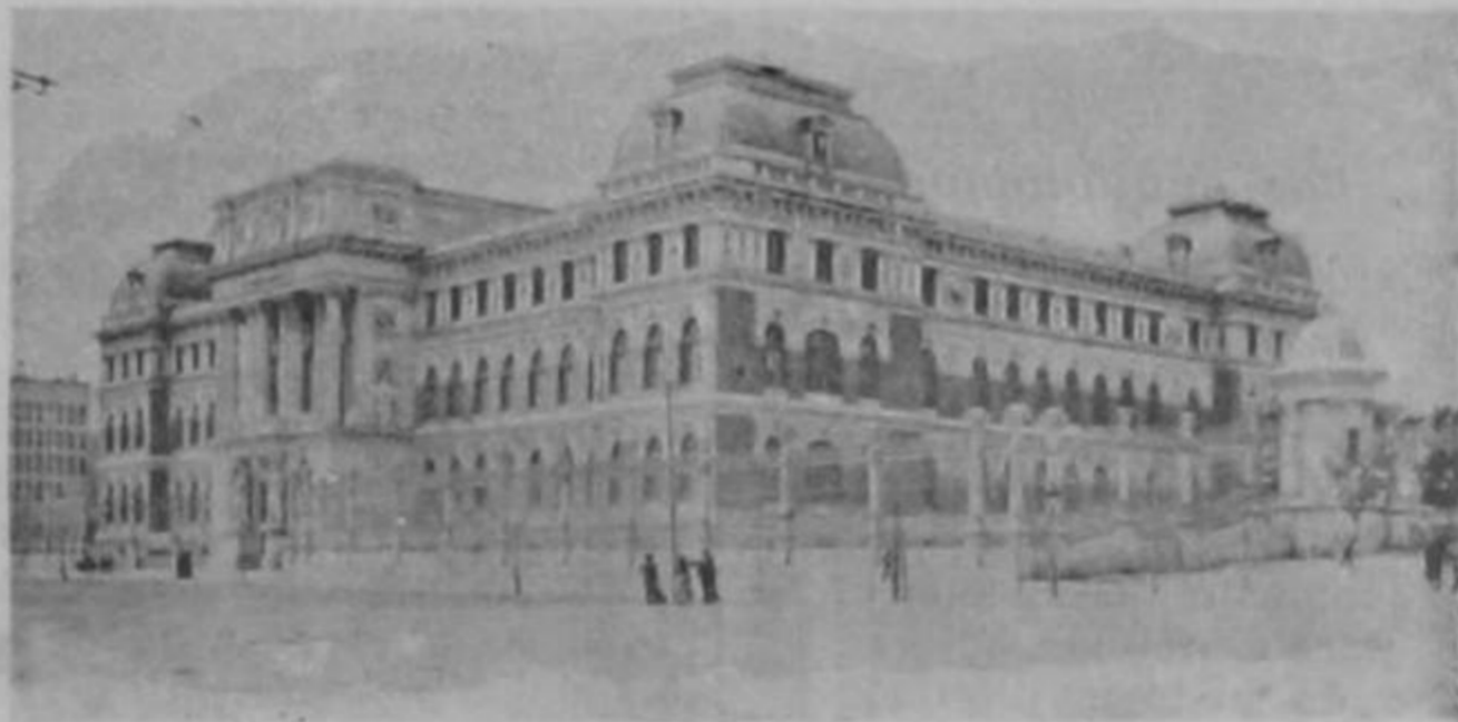
El Ministerio de Agricultura é Instrucción Pública en Madrid

tunas de particulares acumuladas en España, buscaron naturalmente útil y provechoso empleo; pero no es cosa tan fácil hacer mucho en poco tiempo, y esta es la razón de que existan todavía en Bancos españoles y otras instituciones de crédito, cuantiosas sumas en cuentas corrientes. Recuérdese que el desarrollo industrial, económico y mercantil de Inglaterra, Francia y Alemania no se realizó en años ni décadas, sino en períodos más largos, hasta de siglos.