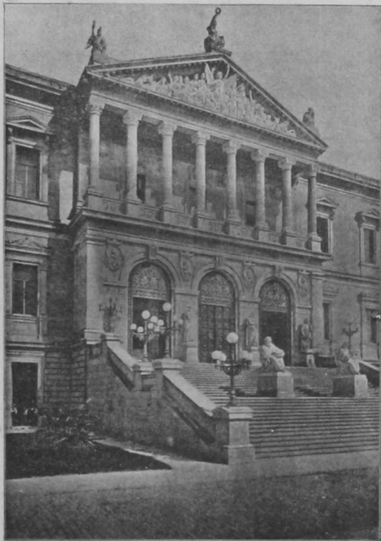
Biblioteca y Museos Nacionales de Madrid

ciones de libros, diplomas, cartas célebres, encuadernaciones artísticas, sellos, monedas etc. que, sin molestar al personal facultativo de aquellos establecimientos, pueden examinarse y estudiarse.