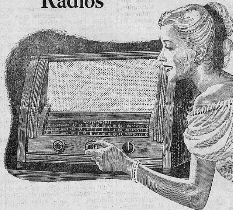
Modelo H-141 - Estilo moderno especial para onda corta "Tropicalizado"