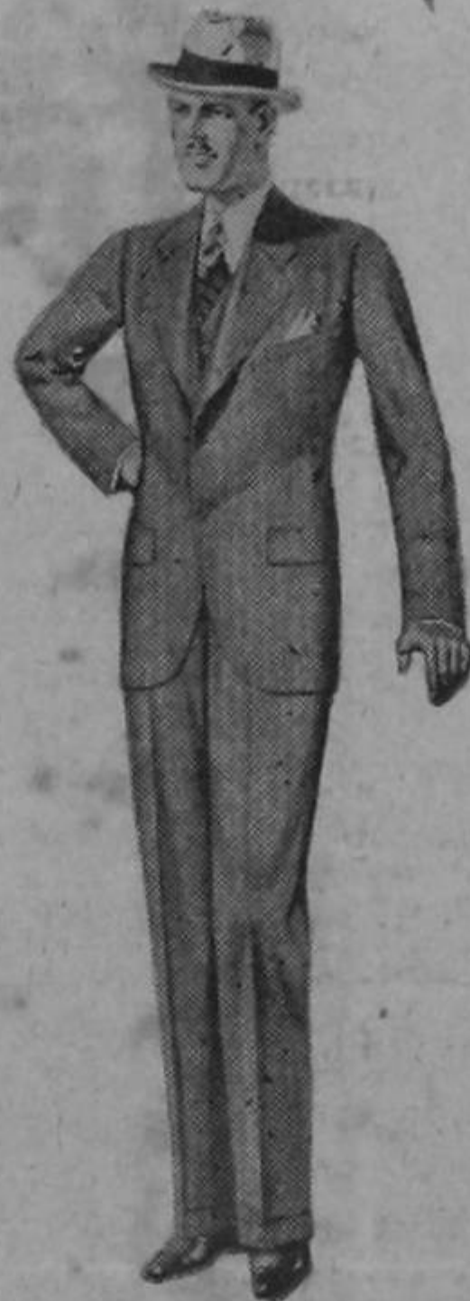
La gente chic se distingue por su elegancia!