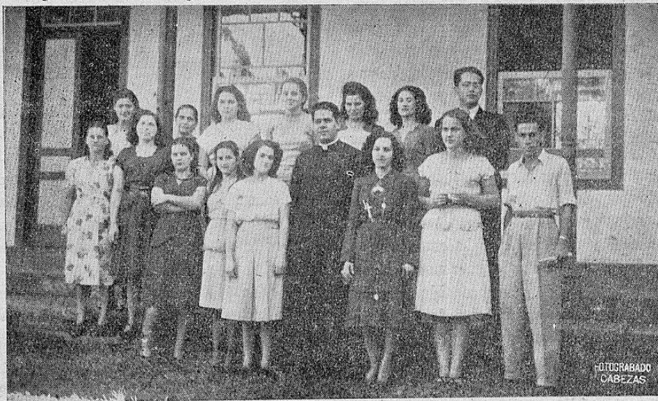
La foto muestra el grupo de personas que está llevando a cabo con todo entusiasmo la organización de una cooperativa avícola en la ciudad de Palmares, y de la cual se habló en el Nº 3 de "El Cooperador Tico".

"Después de un año de intensa lucha nos reunimos de nuevo para tratar los asuntos de la Cooperativa de Productores de Papas de Cartago. La labor ha sido constante y dura, aún cuando interrumpida a principios de este año por la guerra civil. No obstante todo esto, y en el momento más álgido, cuando el precio de nuestro producto llevaba una carrera descendente y habría llegado, a no dudarlo, a ₡ 150 la carga y tal vez menos, la Cooperativa emprendió con más fuerza su tesonera labor. Así vemos ahora que, con la ayuda del Ministerio de Agricultura y de la Sección de Fomento de Producción del Banco Nacional, se logró mejorar los precios en forma bastante satisfactoria para los productores.