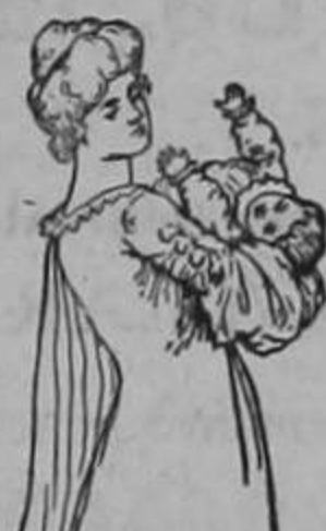
(Para la señora embarazada y para la madre q. está criando.)

NOTA: Si estas son sus cualidades esenciales, ¿por qué no queda Ud. convencida como otras señoras y señoritas que han sentido sus beneficios, si Ud. también puede hacerlo como las demás?. Además, es un remedio que tiene la propiedad de prevenir las enfermedades del sexo, antes que ellas puedan desarrollarse, combatiéndolas victoriosamente. Las señoras no deben olvidar que el Compuesto Mitchellia, es un remedio inofensivo que propicia el feliz advenimiento del ser que aspiran las madres. No solamente contribuye al rápido y absoluto restablecimiento después del parto, sino que proporciona a la madre ponerla en condiciones de amamantar su niño ofreciéndole abundante alimento de su pecho. Comience cuanto antes la primera prueba y observe los resultados. Es de substancias vegetales y absolutamente inofensivas. Pídalo en las Boticas y Droguerías e insista en que el Sr. Boticario le dé el Compuesto Mitchellia. DR. J. H. DYE MEDICAL INSTITUTE, Buffalo, N. Y., E. U. de A.