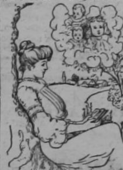
(Para la señora q. está entristecida porque le parece imposible ser madre.)

El Dr. H. R. Koen de la Facultad de Medicina de París, de Port-au-Prince, Rep. de Haití, CERTIFICA: "He prescrito a mis enfermas el Compuesto Mitchellia habiendo obtenido admirables resultados en los siguientes casos: Para calmar los dolores frecuentes durante el embarazo y el parto, flores blancas, menstruación dolorosa y como tónico reconstituyente. Lo recomiendo a las señoras y señoritas que sufren de iguales dolencias."