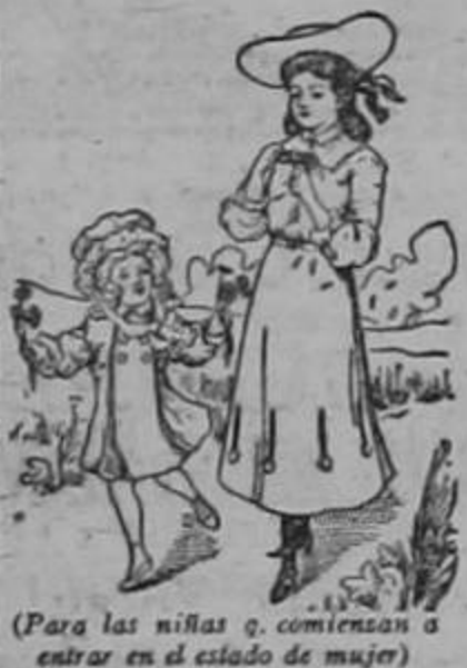
(Para las niñas q. comienzan a entrar en el estado de mujer)