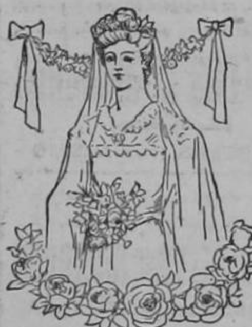
(Para las jóvenes débiles, nerviosas o demacradas.)