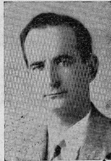
DON JOSE FIGUERES Presidente de la Junta