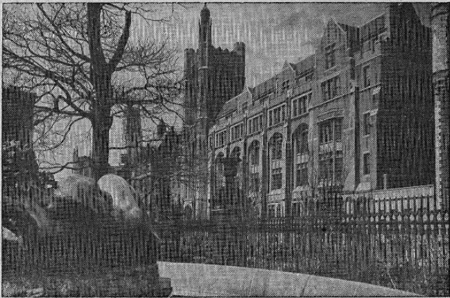
Este es el edificio de la sección de maestros de la Universidad de Columbia, en el Estado de Nueva York

San José de Costa Rica, octubre 27 de 1948.