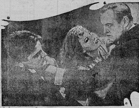
LEW AYERS * GRETA GARBO and ANDERS RANDOLF in "THE KISS"

CONRAD NAGEL y GRETA GARBO en la magistral película Sonora y Musicalizada titulada: