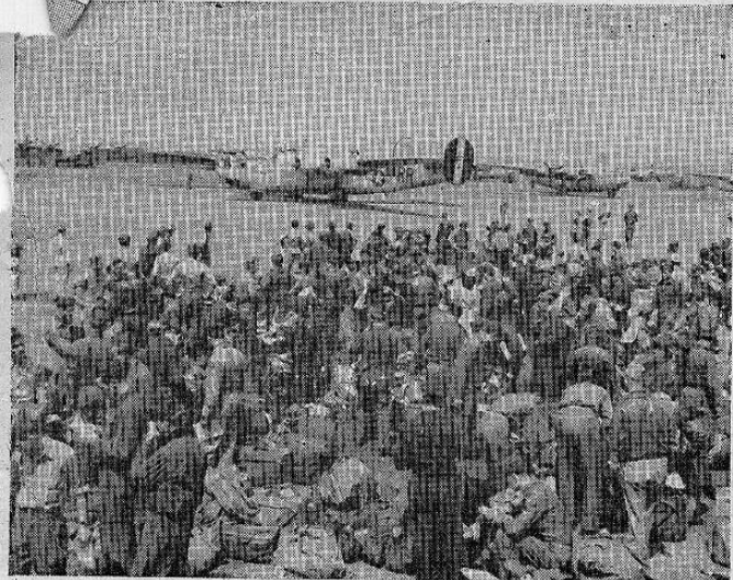
Esta foto muestra la escena en un aeropuerto militar de los Estados Unidos a la llegada de mil aviadore que atravesaron el Atlántico en cincuenta bombarderos. Después de un período de instrucción especial los aviadore seguirán al Pacífico para entrar en acción contra los japoneses.