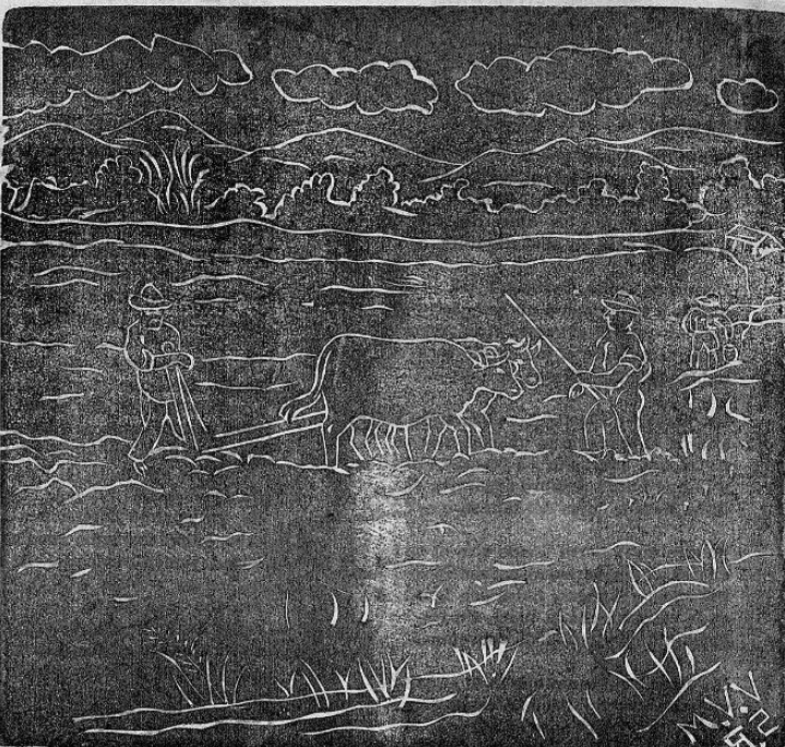
Xilografía de Marcelino Villegas V. Trabajo literario del Cor. Próspero Abarea M. A paso tardos los bueyes van surcando el duro suelo, entre tanto el labrador con su mitrada que es vuelo,

Art. 9º.—Para el gobierno de la Asociación habrá una Junta Directiva compuesta de: Presidente; Vicepresidente; Secretario; ProSecretario; Tesorero; Fiscal y 9 vocales. Será elegida el 24 de junio o el cuarto domingo del mismo mes de todos los años tomando posesión el siguiente domingo. Durará en funciones