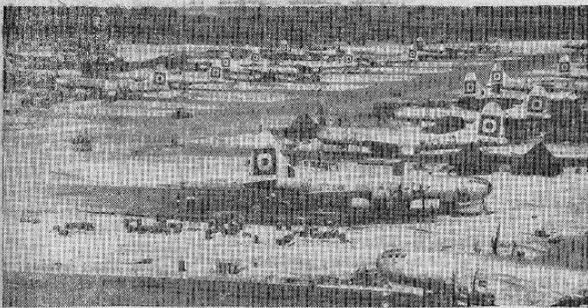
Superfortalezas B-29 del ejército de los Estados Unidos preparándose para atacar al Japón en una base del Pacífico. Los tremendos ataques aéreos contra las islas del imperio japonés propiamente dicho han reducido las fábricas de armamentos de Tokio a un montón de ruinas humeantes.