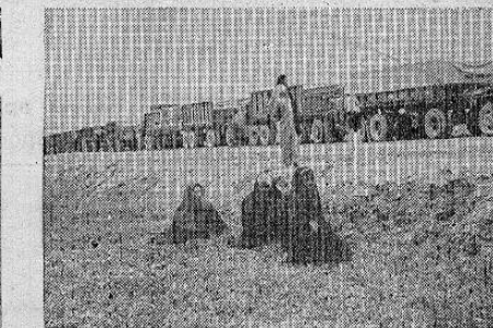
Una caravana de camiones de los Estados Unidos cargados de vituallas, pasa por Persia, camino a Rusia.

WASHINGTON.—Los formi- dables ejércitos rusos, que de manera tan poderosa contribu- yeron a la derrota de Alemania, tuvieron la ayuda de millones de toneladas de comestibles, municio- nes y toda clase de elementos de guerra despatchados por los Estados Unidos a la Unión So- vietica conforme al plan de pré- stamos y arrendamientos.