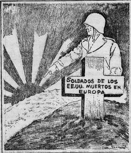
Usadas en el Harford Courant.