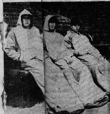
Las lluvias de abril los vientos fríos no hacen temer a la White Sox de Chicgo, en esta estación...