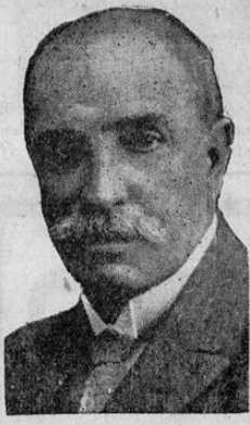
Lic. don Ricardo Jiménez Oreamuno a nuestro redactor esta mañana, cuando le pidió unas frases para LA NUEVA PRENSA.