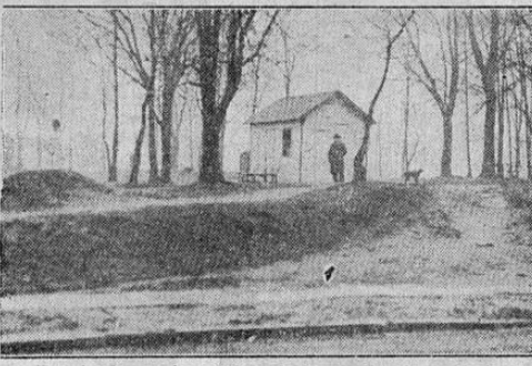
Este bosque en las afueras de Nueva York, es donde el doctor John F. Condon, intermediario del coronel Lindbergh en las investigaciones por el niño sustraído, tuvo una conferencia con un emisario de los raptadores. El padre de esta entrevista, pero no obstante, el famoso viajador sigue sin conseguir el regreso de su hijo. Este documento es propiedad de la Biblioteca Nacional 'Miguel Obregón Lizano' del Sistema Nacional de Bibliotecas del Ministerio de Cultura y Juventud, Costa Rica.

Hasta el medio día de hoy no se comenzó a imprimir el Mensaje Presidencial; tendrá necesidad de trabajarse esta noche, en la Imprenta Nacional, para que esté listo mañana en las primeras horas de la mañana. Contiene treinta y dos páginas, en las cuales el señor Presidente expone a grandes rasgos la labor suya en el último año de Gobierno. El capítulo de los sucesos del 15 de febrero es arrojado, bastante significativo y por cierto que manifiesta su anhelo, como está Pasa a la Pág. 6