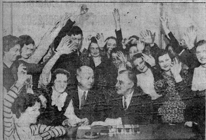
Esta fotografía muestra el entusiasmo con que fue recibido el gobernador Franklin D. Roosevelt cuando hizo su primera visita a los cuarteles de su campaña presidencial para conferenciar con su Jefe de Acción James A. Farley (a la izquierda).