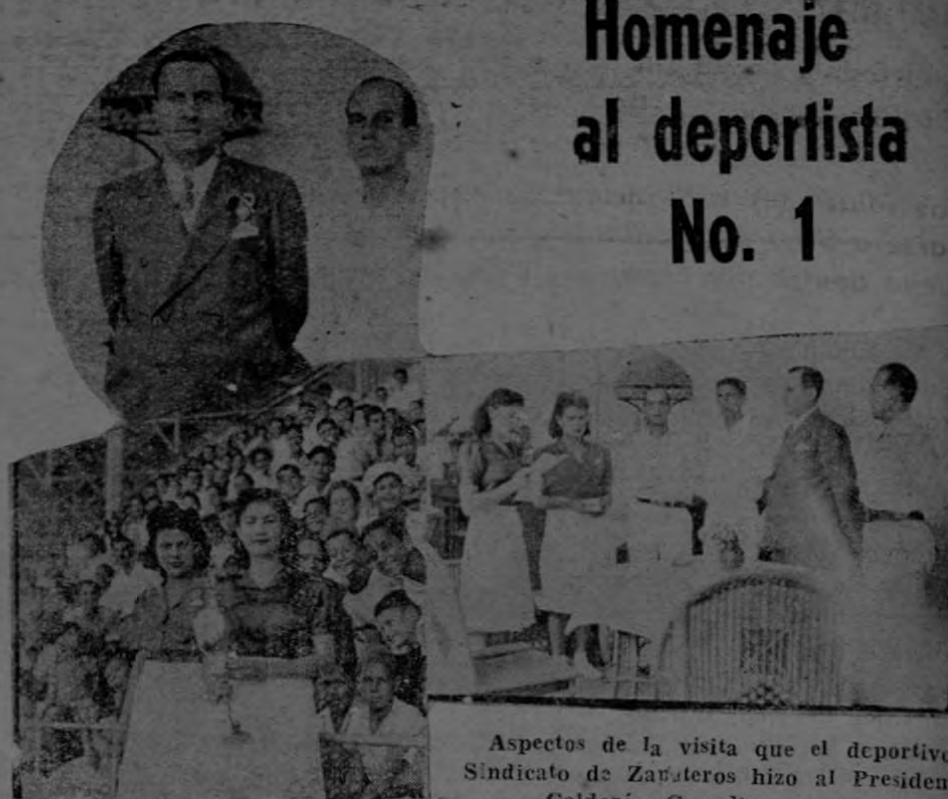
Aspectos de la visita que el deportivo Sindicato de Zapateros hizo al Presidente Calderón Guardia.