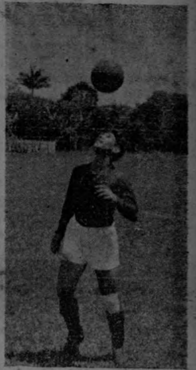
MORERA, el "Mago del Bálón" haciendo algunos de sus matabares.

Solo nos queda por llevar a las filas del T. O. P. a los jugadores costarricense.