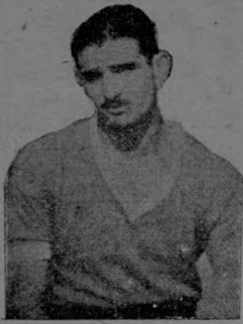
DE LA MATA

Donde todos coinciden, es en el eje delantero ideal: que sea brillante y positivo a la vez. Vale decir, con las virtudes de Erico y Bernabé Ferreira unidas. Técnico como Piendibene y positivo como Petrone. Maestro como Harry Hayes y oportunista como Marcovechio, Estilista como Laferrara. Perspicaz como Lángara y artista como Erico. Decisivo como Tarasconi y habilidoso como Gabino Sosa. Pero el hombre ideal no ha surgido todavía y será difícil que aparezca alguna vez.