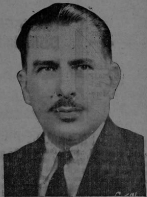
Lic. don Teodoro Picado M.

Es indudable que el deporte nacional ha recibido durante el gobierno del Dr. Rafael A. Calderón Guardia un apoyo e impulso efectivo. Reconocido como un deportista de verdad, no sólo por su entusiasmo, sino porque ha sido jugador activo, porque vistió el jersey de futbolista y quemó al sol energías, su llegada a la Presidencia postulado por el PARTIDO REPUBLICANO NACIONAL fué recibida por el deportismo nacional como el Presidente que, por serlo, ayudaría al deporte en todas sus manifestaciones y ocasiones. Así ha sido en verdad. Sus afanes cultural-deportivos se tradujeron en una Ley que creó un Consejo Nacional de Educación Física, institución que inspirada en los propósitos de progreso que animaba al Presidente Calderón Guardia, también ha hecho labor de progreso y bienestar deportivo.