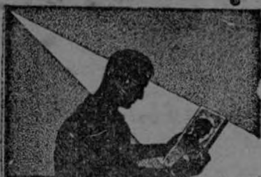
FOTOGRAFADO DE LA TRIBUNA EL MEJOR DE CENTRO AMERICA

con seguridad, fuerza y potencia tan bien como lo hace su hermano, quizás la mejor pierna del actual campeonato.