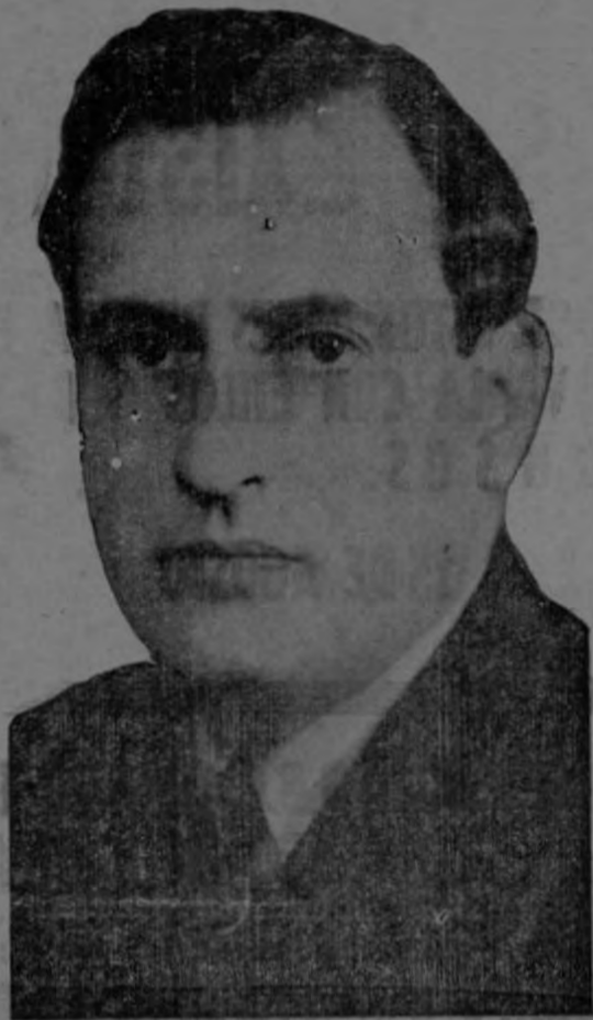
Dr. D. Rafael A. Calderón Guardia

El Partido Republicano Nacional hoy en el Poder y mañana también, vencedor siempre, hará obra de bien deportivo. — Hoy con el doctor Calderón Guardia y después con Teodoro Picado en la Presidencia la actividad deportiva nacional recibirá siempre protección para su desenvolvimiento y progreso