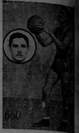
NANCHO Obsequio de la Tabacalera Costarricense

EL PRELIMINAR DE PRIMERAS DIVISIONES QUE ESPERAN LOS LICEISTAS PARA REIVINDICARSE. LA BARRA DEL LICEO LLENANDO EL "ESTADIO MENDOZA" DE BOTE EN BOTE.