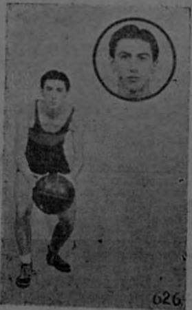
PALITO Obsequio de la Tabacalera Costarricense