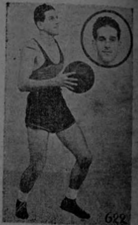
BEIRUTE Obsequio de la Tabacalera Costarricense