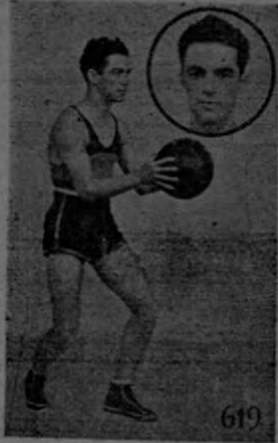
GOLCHER Obsequio de la Tabacalera Costarricense