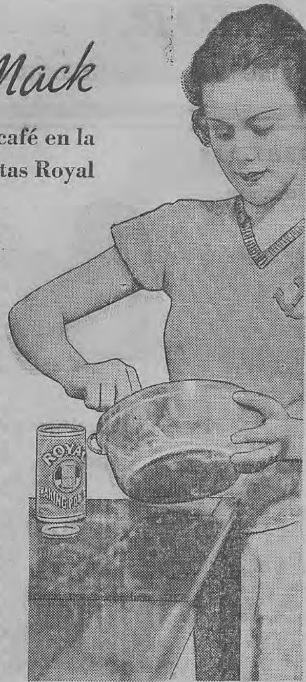
Helen Mack, Estrella de la Película RKO-Radio, "El Hijo de Kong"

BIZCOCHO DE CAFE 1/4 taza de mantequilla (115 gramos) 1 1/2 tazas de azúcar morena (225 gramos) 2 huevos 1 cucharadita de extracto de vainilla