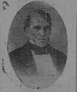
General ANTONIO PINTO, nativo de Oporto, Portugal, que dirigió el movimiento contra Morazán

ción que coló de León. El panorama centroamericano era el resultado de la dejación y el olvido en que vivimos durante el colonialismo. Ojalamos el "Memorial de la Soberanía Económica de Amigos del Estado de Guatemala, de junio de 1839, N.º 3: "Cerca de tres siglos de gobiernos no absolutos produjeron resentimientos y enojos que estuvieron reprimidos por largo espacio de tiempo. Llegó al fin el día de exhalarse: se gritó INDEPENDENCIA; y empezó la lucha, tan obstinada como sangrienta entre los españoles que querían conservar su metida y los americanos que deseaban emancipar la América. (Ver columna 1ª—Página 12.)