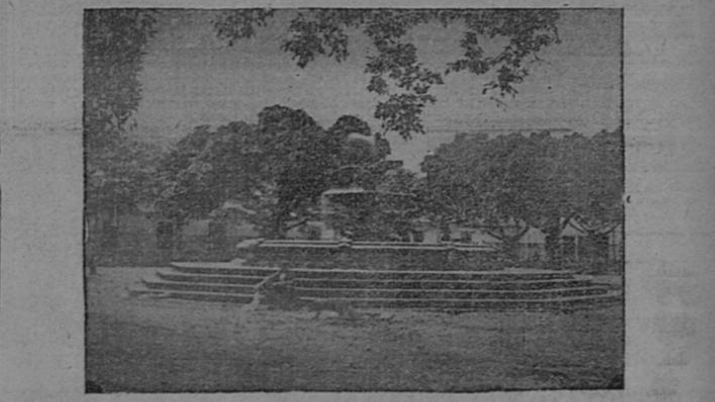
Plaza Principal de San José, hoy Parque Central, en cuya esquina sureste fueron fusilados Morazán y Villaseñor, el 15 de Setiembre, 1842

Hemos de enfocar, preferentemente, el panorama centroamericano en los azarosos días finales de la Colonia y los albores de la Independencia. La vida en los días coloniales sólo dejó un recuerdo ingrato: algunos conquistadores se impusieron por la fuerza de su espada; crearon fuertes tributos; trataron a los nativos como a poseedores de tierras. Por su lado, los indígenas levantaban templos y hoste-