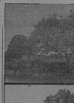
Sitio denominado El Jacote, de San José de Ajajuela, donde pactaron Morazán y Villaseñor, en abril de 1842.

historiador, como el juez,—humano también—cuando lo es de verdad, abonda la causa, analiza las condiciones psicológicas, compara las causas naturales, releo los documentos y las pruebas, estudio el medio geográfico, considera el ambiente, hace deducciones, interpreta los hechos y madura su fallo, que a veces le obliga a largas horas de vigilia. Es que hay un sen-