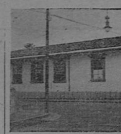
Casa de Heredia, diagonal a la catedral, donde el General Morazán firmó el primer decreto, asumiendo el Gobierno de Costa Rica.

grandes hechos históricos no son... no pueden ser producto exclusivo de la espada. Deben buscarse las profundas causas naturales. Los poderosos factores psicológicos, que fueron parte determinante de esos hechos. Los genios individuales, los que se toman como tales, suelen rodarse de una aureola que realza su figura para quienes juzgan sin ahondar las causas. Y cuando el proselitismo cobra alicance, es difícil la tarea de reajustar el histórico.