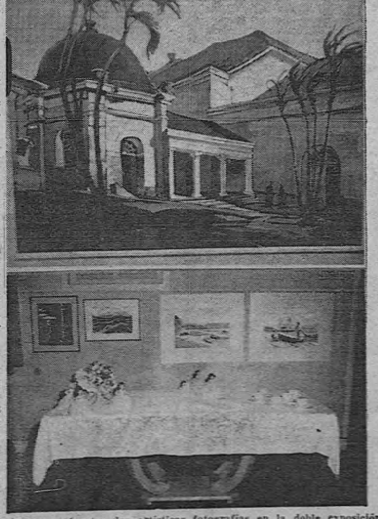
ROA captó estos dos artísticas fotografías en la doble exposición inaugurada, ayer en el Museo Nacional...