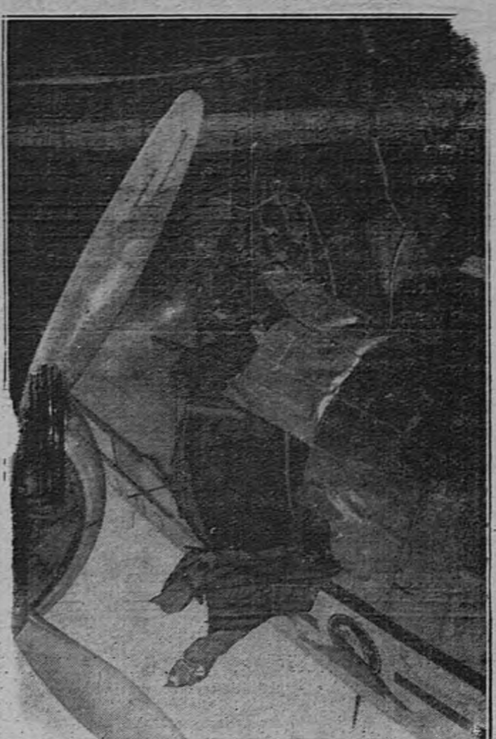
Aspecto del costado del avión que muestra el tremendo agujero que hizo la bomba.