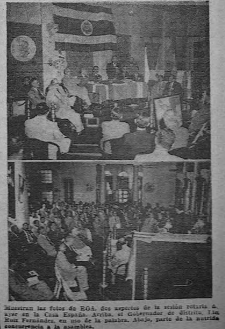
Muestran las fotos de ROA, dos aspectos de la sesión rotaria de ayer en la Casa España...