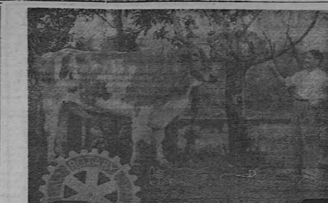
Hermoso ejemplar "Braama" donado por la firma Rojas-Cortés para la fiesta rotaria de hoy.

Dijimos sin exagerar que todas las damas que presentaron trabajos, han demostrado su sentido artístico, su culto a la flor y la belleza.