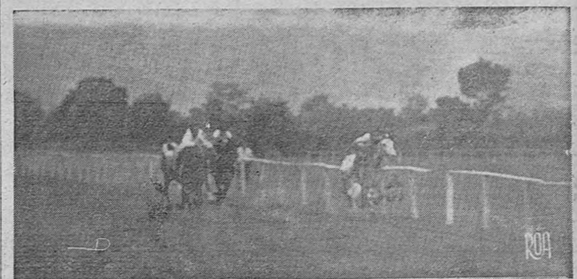
Aquí van ya en la tierra firme. Los jockeys fustigan a las bestias, porque ya está cercana la meta. Sugar Lad en primer término, le lleva dos cuerpos a Carola, y a Lilly, que tratan de ganar terreno.