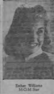
Esther Williams M-G-M Star