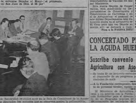
Fotografías del Ministerio de Salubridad tomadas ayer en la Sala de Comisiones de la Asamblea Legislativa, explicando a los diputados las medidas que se observan contra la poliomielitis.