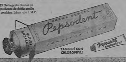
"El Detergente Oral es un ingrediente de doble acción que combina Irium con I.M.P.

Conserve sus dientes más limpios y su aliento más fresco... luzza una sonrisa más radiante usando diariamente la Crema Dental Pepsodent con su detergente ORAL.