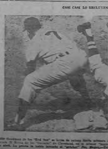
El primer pase de los "Yankees" de Nueva York el día de Mayo, en Nueva York. El primer pase de los "Yankees" G. McDonald, recibió la pelota lanzada por el "catcher" Yori Ben demandado tarde para poder eliminar al muy vivo "Spook".