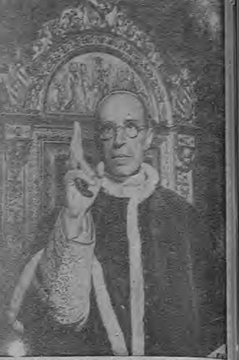
POPE PIUS XII