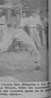
Por George Mc Man...