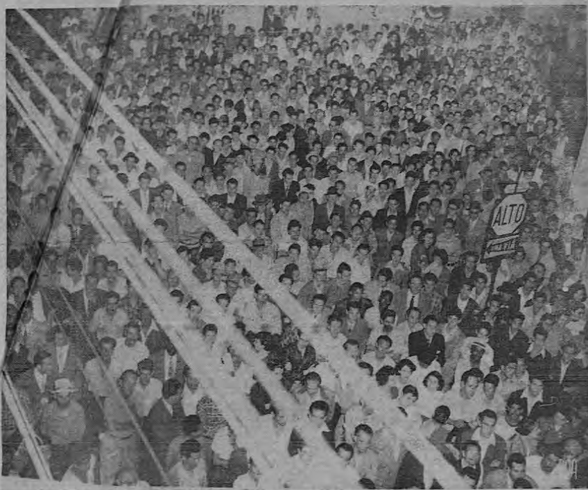
Los de ciudadanos, que al llamado del Comité pro-Reforma, acudieron en masa ante las oficinas de DIARIO DE COSTA RICA pidiendo que se arreglara don Otilio Ulate. En esta espléndida panorámica de R.O.A. se aprueba parte de esa multitud que llenó totalmente las calles adyacentes a nuestras oficinas. La foto se concentra sólo sobre los manifestantes que se ubicaron en la esquina central. Fuera de foco, miles de ciudadanos más estaban de pie desde el Teatro Raventos hasta el Almacén Kobeg.—