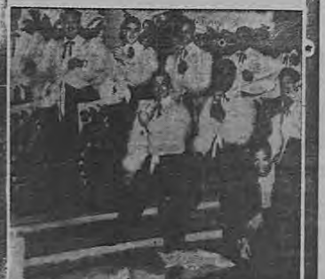
Reproducción de la película "Rob Roy, el Gran Rebelde".