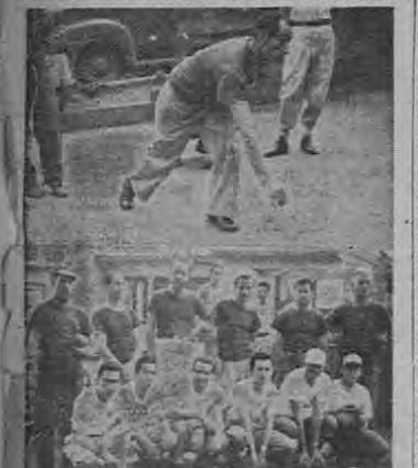
Primera fotografía que se publica en Costa Rica, del campeonato de bochas que se está llevando a cabo en Guadalupe, Arriba, Miguel Alemán, trata de hacer un tanto, y abajo, dos de los equipos participantes en este interesante torneo. (Foto Montero).