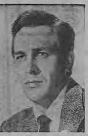
Howard Keel