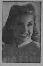
Esther Williams M-G-M Star