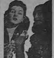
¿Pueden desconocer estos detalles íntimos?