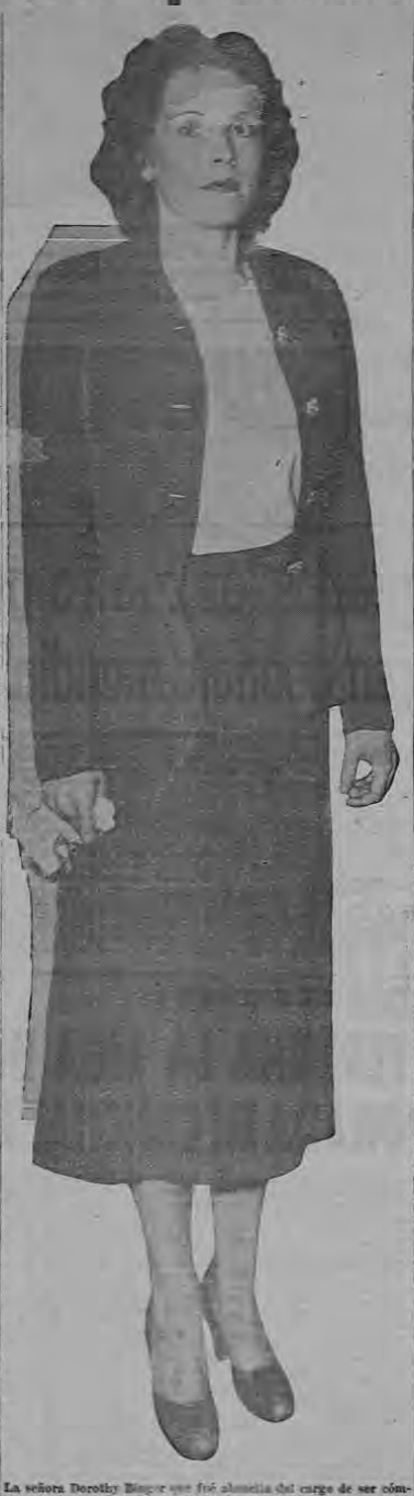
La señora Dorothy Binger se fue a la cárcel por el asesinato de su marido.