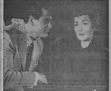
Rock Hudson encuentra a Jane Wyman de nuevo, después de una prolongada búsqueda, en la película "Magnificent Obsession" de la Universal International. Basada en la novela de Lloyd C. Douglas, esta producción en tecnicolor ha sido altamente elogiada por la crítica norteamericana.

"Magnificent Obsession", la gran historia de amor de Lloyd C. Douglas en color por Technicolor, dirigida por Douglas Sirk y producida por Ross Hunter, es el nuevo título de la Universal. En su estupendo reparto están la gran actriz Jane Wyman, ganadora de un Academy Award por sus maravillosas interpretaciones de la sordomuda en "Belinda" y quien ahora desempeña un papel decisivo en el papel de ciega en "Magnificent Obsession".