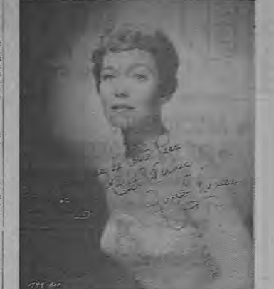
La exqu coast Jane Wyman, protagonista de la película de Universal International, "Magnificent Obsession", aparece en esta fotografía en pose especial para nuestro periódico. Puede leerse en ella la siguiente inscripción: "YO DIARIO DE COSTA RICA, Best Wishes, Jane Wyman".