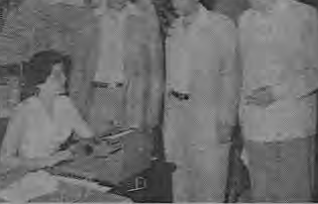
Inscribiéndose en el V Congreso Interamericano de Turismo que actualmente se celebrará en el Hotel El Panamá en la ciudad de Panamá, vemos a algunos de los delegados de Costa Rica.

Los delegados de las Tierras Interiores viajaron ayer a Panamá para asistir al V Congreso Interamericano de Turismo.