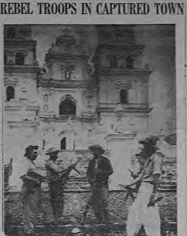
Anti-Communist soldiers, carrying modern automatic weapons, stand before a church in Escuintla, Guatemala, first town taken by the rebels. The rebels claimed June 23d that they are advancing on Guatemala City from three directions, while the government forces countered with a claim that the rebels had been repulsed and were fleeing.