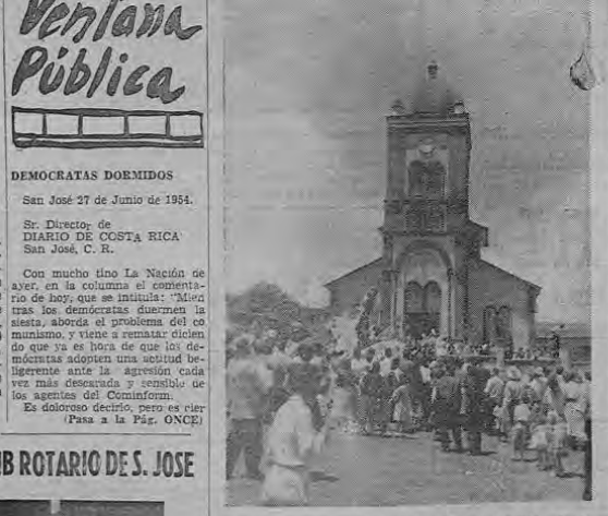
Se inicia la procesión hacia La Cruz de la Misión, donde se edificó el templo votivo del Dulce Nombre de Jesús. Este fue uno de los actos religiosos más brillantes que contempló el programa de la Feria.