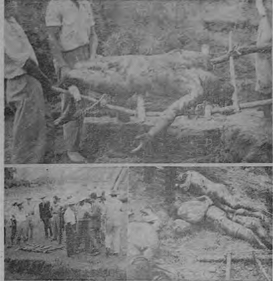
Deprimente espectáculo. Por centenares son exhumados los cadáveres de patriotas anticomunistas torturados y después asesinados en Guatemala. Arriba, un grupo de voluntarios realiza esa tarea con el cuerpo de un campesino violentamente asesinado. Abajo, izquierda, los voluntarios, con el rostro tapado para evitar el olor, se arrojan a los cadáveres. Derecha: más víctimas de la barbarie comunista.