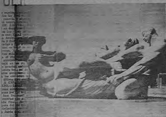
FUENTE MONUMENTAL, JUNTO AL MAR, Por Francisco Zuñiga. Veracruz, 1952.