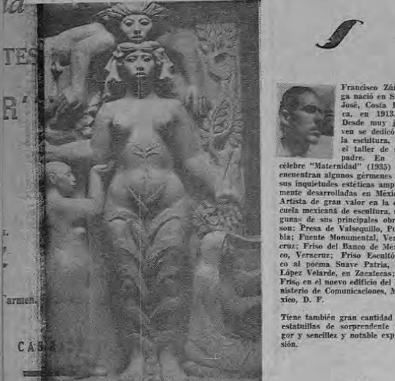
DETALLE DEL FRISO MONUMENTAL, por Francisco Zuñiga. — Nuevo edificio del Ministerio de Comunicaciones, Panamá, 1954.