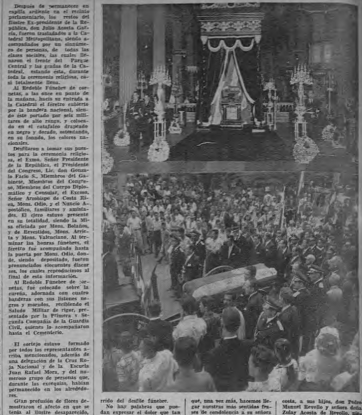
Después de reanudar en capilla ardiente en el recinto panteonario, los restos del Ilustre Ex-presidente de la República, don Julio Acosta García, fueron trasladados a la Catedral Metropolitana, acompañados por un séquito de personas, de todas las clases sociales nacionalistas, que desfilaron el frente del Parque Central y las gradas de la Catedral, estando ésta, durante toda la ceremonia religiosa, casi totalmente llena.