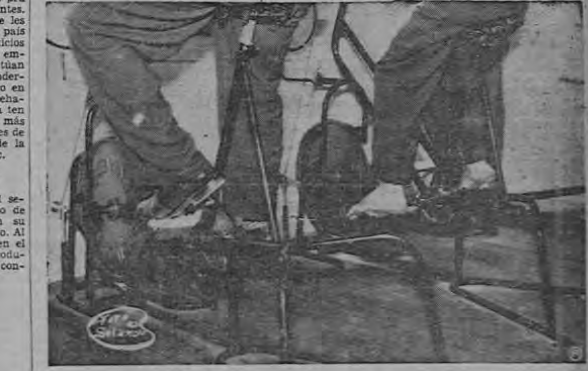
Dos pacientes que sufrieron fractura en la pierna —uno de ellos de más de setenta años de edad— recorran la agilidad y seguridad de movimientos en uno de los aparatos especiales con que está equipado el Departamento de Rehabilitación.