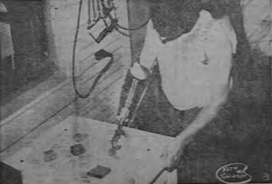
Con el aparato profético, que maneja con habilidad extraordinaria, el amputado copia las figuras geométricas y las coloca con gran precisión sobre los dibujos que aparecen en la mesa.