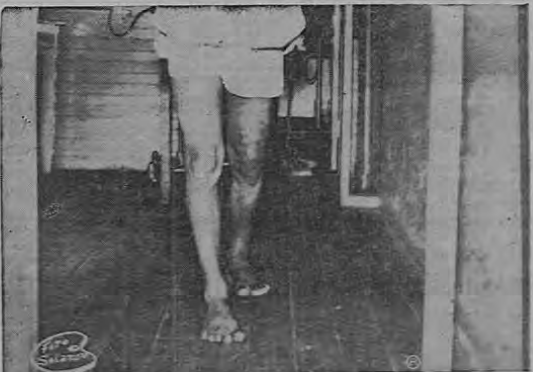
Este trabajador sufrió la fractura del fémur, y se ejercita en caminar, mientras se sostiene, con las manos, de las barras paralelas.