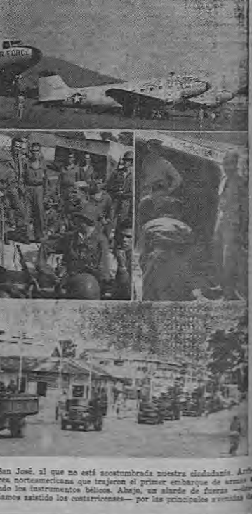
Un espectáculo inusual en San José, al que no está acostumbrada nuestra ciudadanía. Armado, los aviones de la Fuerza Aérea, se trasladan de guerra a un campamento militar al que nunca habíamos asistido los costarricenses —por las principales avenidas de la capital.