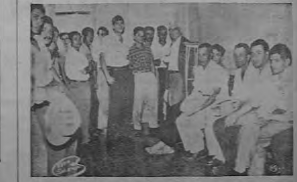
Trabajadores que esperan su turno en el salón de recepción del Departamento de Rehabilitación. En este grupo están nuestra fotógrafa, alrededor de un centenar de personas acceden todos los días para ser atendidas.