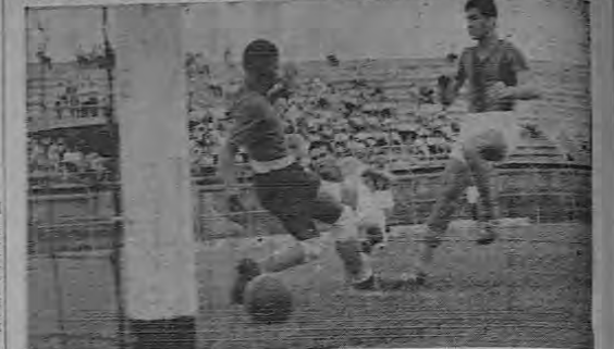
Uno de los goles que le anotaron al arquero Beckler, en el amistoso del domingo frente al Orion...

Como homenaje al doctor Rodolfo Chacón Araya, jugaron el preliminar del estadio los elencos de Moravia y Orion.