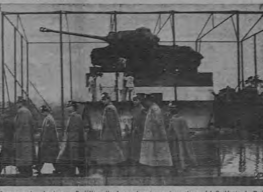
El monumento a los tanques soviéticos situado en el sector nortoccidental del Occidente de Berlín...