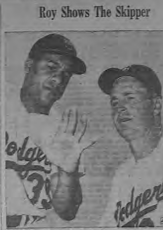
Dodgers catcher Roy Campanella shows manager Walt Alton his sliding left hand before start of game with Philadelphia Phillies.