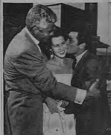
Martha Rocha, representante del Brasil en el concurso Miss Universo, recibe un beso de bienvenida del astro de la pantalla Tony Curtis, mientras Jeff Chandler observa. La fotografía fue tomada durante la visita que las reinas hicieron a los estudios de la Universal-International Film.