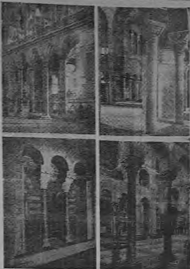
Bajo los auspicios del Imperio Romano el Arte Bizantino, representativo del cristianismo, se preparó por toda Europa, y gran parte de Asia, manteniéndose por espacio de más de diez siglos. Características de la arquitectura bizantina con las cúpulas, y las columnas adornadas con capiteles ricamente decorados. La composición trífida que reproducimos, muestra, a la izquierda, a derecha, interiores de las catedrales de Santa Sofía (Constantinopla) y de San Vital (Rávena, Italia). Abajo: Detalles de las iglesias de Altamura, y de San Marcos (Venecia).