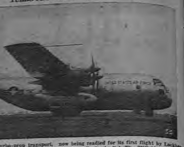
The U. S. Air Force XC-120 Turbo-prop transport, now being readied for its first flight by Lockheed designs and built at the plant, is shown on the runway at Burbank, Cal. The "YV-120" will carry up to 28 tons at higher speeds than any other transport now flying, says Lockheed. Four 3,200-hp turbo-prop engines power the huge plane. Features of the design is the high, tapered tail for rear-end landing.

Labor Leader Killed in Mexico MEXICO CITY, Aug. 11.—(AP)—A prominent moving picture labor leader was killed last night in front of his home by two unidentified men. The leader was a well-known figure in the labor movement.