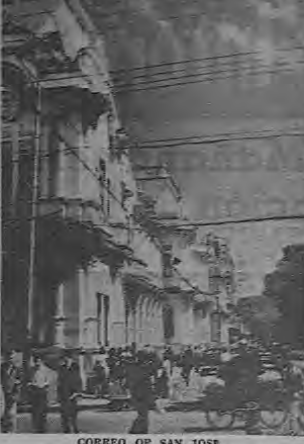
CORREO DE SAN JOSÉ