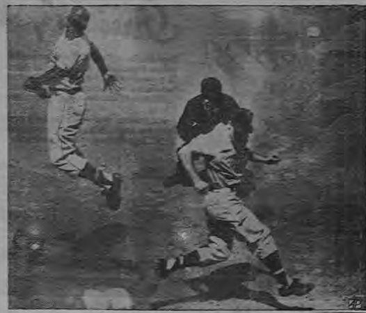
Con sus sombras dando aspecto "surrealista" a la fotografía, el "outfielder" de los Athletics...