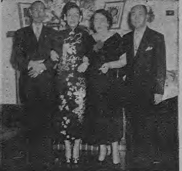
En la sede de la Legación de China fueron agasajados el martes en la noche el Embajador de El Salvador...