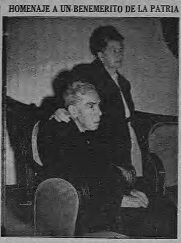
El Liceo de Heredia, la Escuela Normal y los planteles de primera enseñanza de Heredia...