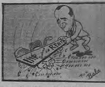
—Esto era lo que faltaba: la tablita de cálculos de la revista...