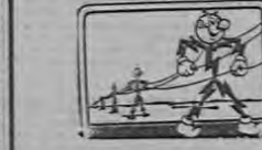
BEDDY KILWARY Su Servidor Electrico

TELEFONOS 4042 - 2220 - 3252 PARA ENVIAR POR SU ECONOMICO