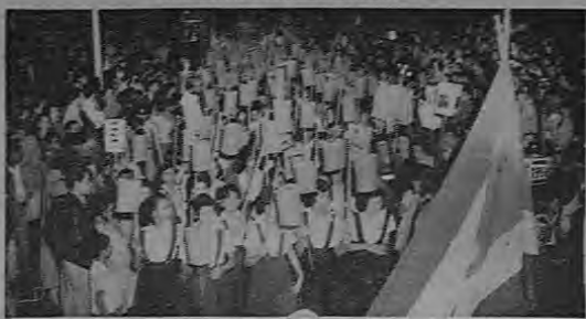
Alumnos de todas las escuelas josefinas desfilaron en la noche del martes portando faros, en celebración del nuevo aniversario de la independencia nacional...