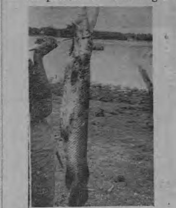
El raro pez con cabeza de caimán, pescado en Caño Negro, por el grupo de deportistas de San José y Alajuela...