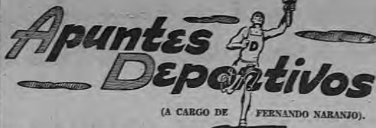
(A CARGO DE FERNANDO NARANJO).