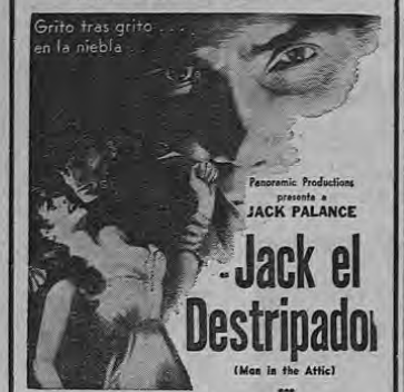
Jack el Destripado (Mac in the Attic)

Un silbido de electrificante emoción! El escalofriante relato del temible degollador de mujeres! El desplomado asesino que aterrorizó a Londres en el siglo XIX!