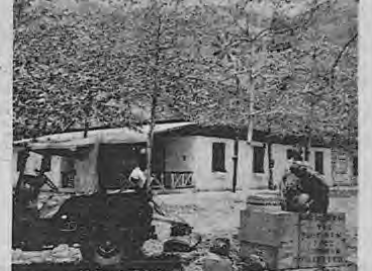
Hotel de Liberia, donde sirven buenas comidas