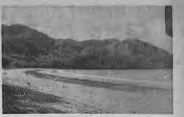
Tranquilas playas del Coco, sitio de recreo de los liberianos

bería. La cría de ganado es la industria más floreciente. Según el último censo tiene 487 habitantes, de los cuales 2,219 son hombres y 2,378 mujeres.