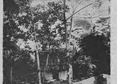
Típico rancho en los alrededores de la ciudad