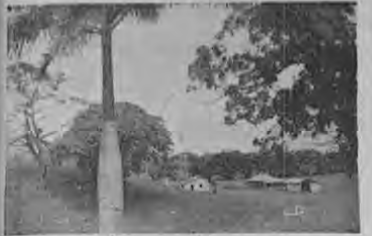
Moderna finca de ganado con molino de viento y energía eléctrica

La Ciudad Blanca, llamada así por la albura de sus calles y sus casas, es un pitón acogedor y hospitalario de la provincia de Guanacaste. El que va una vez, debe volver: queda prendado del ambiente, el paisaje y las personas.