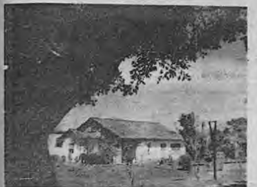
Pacífica mansión liberiana

Liberia es, en fin, un paraíso en pequeño. El turista descansará en ella a la fresca sombra de su exuberante naturaleza, y se recrea con el trato amable de gentes sencillas y generosas.