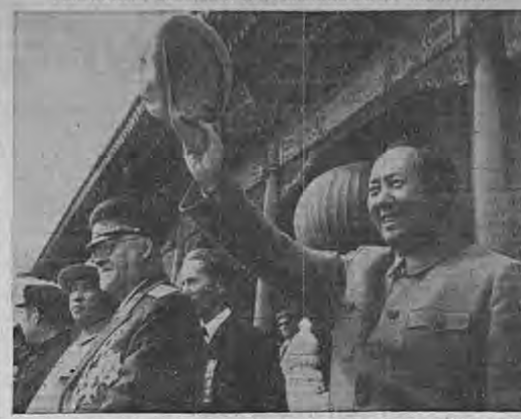
El Presidente Mao Tse-tung, de la China Roja, saluda con el sombrero que desfiló durante cuatro y media horas, en Peiping temprano de Octubre de 1954, celebrando el 5º aniversario de la China Roja. El vice-Presidente de Rusia, N. A. Bulganin, con el pecho cubierto de medallas, —tercero desde la izquierda— presencia el desfile. El Primer Ministro de la China Comunista, Chou En Lai está a la extrema izquierda mirando lejos de la cámara. Kim Il Sung, Primer Ministro del Norte de Corea, es el segundo desde la izquierda.

Funcionando en casi todos los países del Nuevo Continente el correspondiente Instituto de Cultura Hispánica autónomo, todos los aspirantes a becarios tienen el camino expedito y rápido para inscribirse y ser seleccionados.