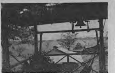
Una finca donde fabrican apetitoso queso

Su suelo es plano en el centro y en el sur, y hacia el norte un tanto quebrado. Lo riegan los ríos Tempisque, Colorado y Li-