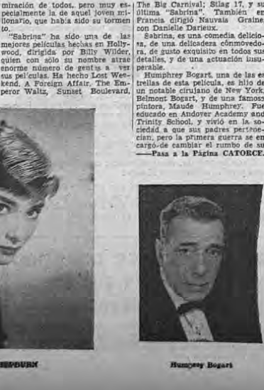
William Holden, Audrey Hepburn, Humphrey Bogart