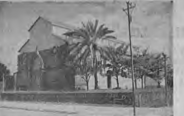
La hermosa Iglesia

Bellezas Naturales de Costa Rica. — LIBERIA Por JUAN M. VICTORY