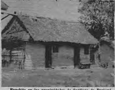
Ranchito en las proximidades de Santiago de Puriscal