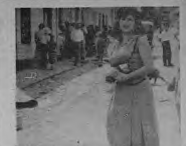
Hermosa maestra puriscaleña

de todos los lugares circunvecinos que tratan para vender tabaco, patatas, frijoles, maíz, etc. y presenta un movimiento comercial fuerte, pues el cantón es muy fértil y las gentes muy trabajadoras.