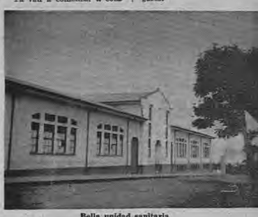
Bella unidad sanitaria

Puriscal tiene paisajes bellísimos, sobre todo en los pueblitos cercanos, como Barrocas, Mercedes Sur, Candelaria, don de se aprecia la naturaleza en todo su esplendor, gozando de las gentes tan serviciales y acogedoras, que realmente se pasa a un rato ameno visitando estos bellos y pintorescos lugares.