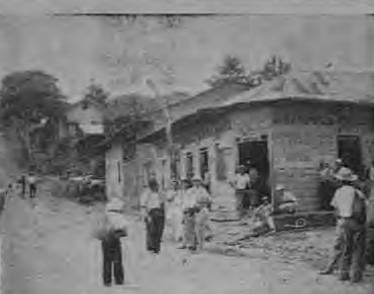
Pulpería y camino hacia Barrocas