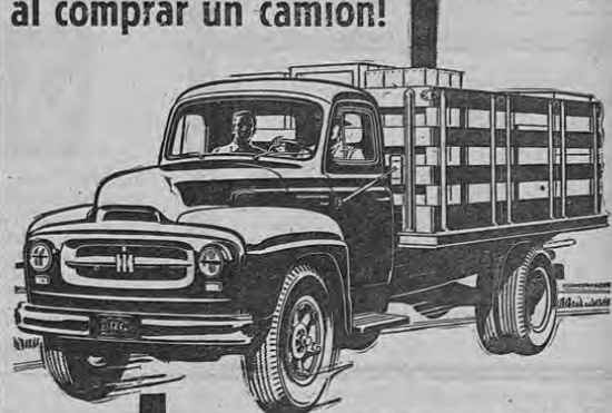
INTERNATIONAL - Modelo R-160 - Capacidad de regimen desde 14.000 hasta 17.000 libras, peso bruto del vehículo.

Seleccione el INTERNATIONAL que se ajusta exactamente a sus requisitos de trabajo. He ahí la manera de obtener mayores ventajas por su dinero invertido en un camión.