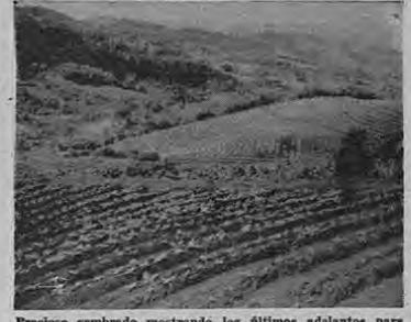
Precioso sembrado mostrando los últimos adelantos para evitar la erosión