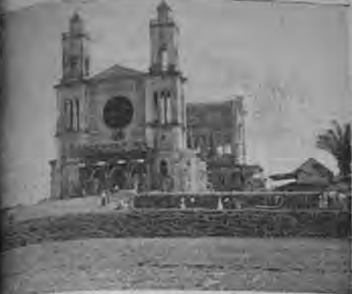
La moderna y amplia Iglesia

El moderno y rico cantón situado al S. O. de San José, conocido a este por una magnífica carretera, contando con un servicio de camiones que trasladan con bastante regularidad. Se extiende por el Noroeste hasta el río Grande de Tarrazú; limita al Sur con Puntarenas; al Este está separado por el río Pizarro, que lo separa del cantón de Mora, y al Oeste limita con el cantón de Tururares.