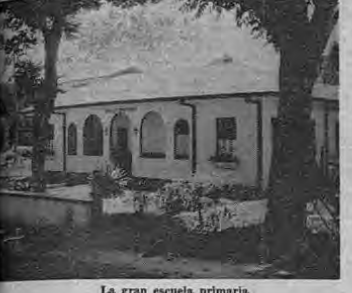
La gran escuela primaria