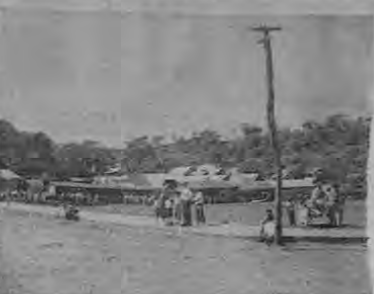
La plaza y el mercado provisional

Los Domingos llegan gentes peñosamente en la terminación de una hermosa iglesia, fuerte y artísticamente construida de ladrillo, concreto y piedra; es de estilo moderno y una de las más grandes del país.