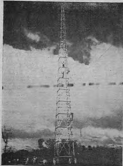
Torre de 150 pies de alto, que conduce la línea de transmisión de 33.000 voltios, de Nagatac a Puntarenas. Esta línea es parte de la Red Central de Interconexión.

Cuando se complete la primera etapa de este plan, a fines de 1956, el país empezará a disfrutar de sus beneficios.