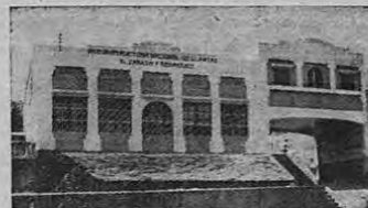
Constructora Nacional de Llantas Alvarado y Rodríguez