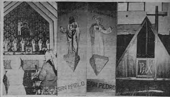
El domingo se celebraron en horas de la mañana actos de bendición e inauguración de un altar, dos imágenes —de San Pedro y San Pablo, respectivamente— y un moderno confesionario, en la Iglesia de la Virgen del Perpetuo Socorro, en Calle Morenos. Ofició las ceremonias el Obispo de San Isidro de El General, Monsenor Delfin Quesada. En la gráfica, en el orden usual: el hermoso altar, las imágenes de San Pedro y San Pablo y el confesionario.