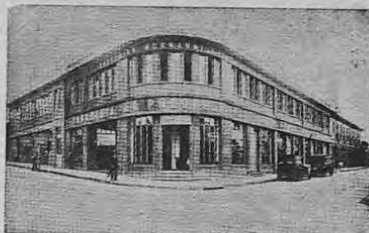
La Gran Panadería MUSMANNI en San José