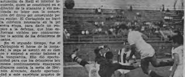
Córdoba envía un centro por la punta derecha; entra Goni al cante, pero envía la esférica sobre el arco, malogrando la oportunidad de sumarle la ventaja el elenco bruno. El argenteo liberto no pudo despejar de puños.