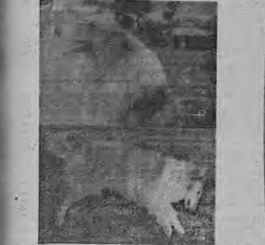
En el grabado superior la más reciente fotografía de "Redy" precioso ejemplar canino, que fue salvajemente envenenado anteojos en Heredia. Abajo, con sus hoces semi-abiertas y los músculos rígidos después de haber sido la víctima de una de las "asesinadas" disposiciones del Ministerio de Gobernación.