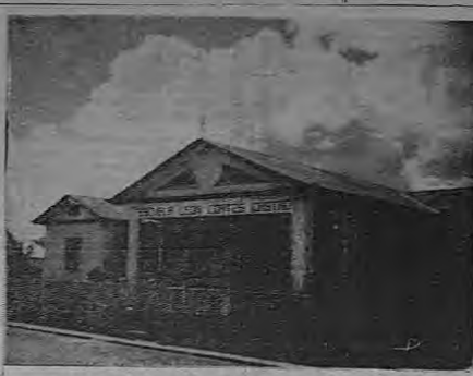
La casa de enseñanza, que lleva el nombre de León Cortés C.