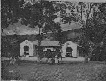
En el marco fresco de los árboles, la Unidad Sanitaria

Telegráficos, Jefatura Política, varios aserraderos, modernos establecimientos comerciales de primera clase. Como a 500 varas del centro está el gran puente de hierro sobre el río Parrita. Ese río tiene aguas termales de grandes propiedades curativas para varias enfermedades, principalmente para las reumáticas. Goza de un clima sumamente agradable, y hay paisajes bellísimos que admirar. Es un lugar magnífico para veraneo. En el verano se puede transitar también por la vieja carretera que pasa por San Pablo, el cerro del Abejón, Frailes, Cardeñal, Corralillo, La Tablazo, San Miguel y San José.