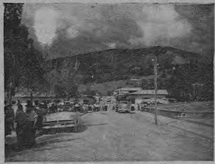
La calle principal, en domingo. Al fondo, el cerro de "Las Cruces"