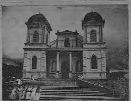
Bello y moderno templo católico con amplia escalinata

Para llegar a este lugar hay que tomar rumbo a Cartago, seguir la carretera Panamericana que va para San Isidro del General y en el Empalme, un poco más adelante del cruce para San Cristóbal, se encuentra la nueva carretera que han hecho para llegar a Santa María de Dota.