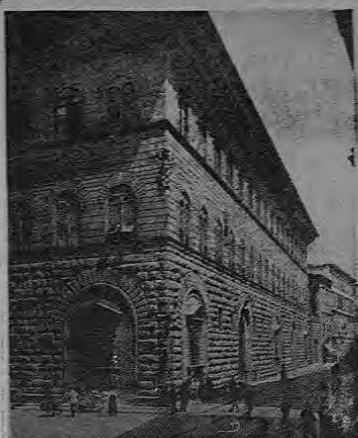
Lo interesante y significativo del estilo Renacimiento es que, habiéndose inspirado en las fuentes clásicas — especialmente en los manuscritos dejados por Vitruvio, (arquitecto romano), cuyo descubrimiento causó gran sensación en la época — también sentó las bases de la arquitectura contemporánea. La reproducción muestra el Palazzo Medici, obra del arquitecto Michelozzo.