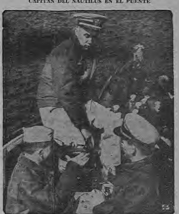
CAPIATAN DEL NAUTILUS EN EL PUENTE

La Administración Postal de las Naciones Unidas ha puesto en venta una nueva estampilla en honor de la obra realizada por la Organización Internacional de la Aviación Civil. La OACI es un organismo especializado de las Naciones Unidas que se dedica a establecer normas universales para la aviación; reducir los trámites de viajes; y prestar ayuda técnica a los gobiernos para organizar sus servicios aéreos. El diseño de la estampilla representará unas alas que vuelan a través del mundo, y fue dibujada por un artista uruguayo.