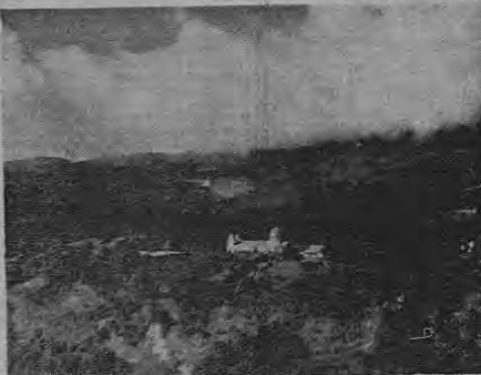
Hermosa vista panorámica de San Marcos de Tarrazú