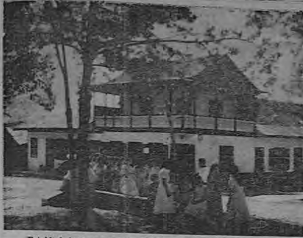
Establecimiento comercial y lindas señoritas de la localidad