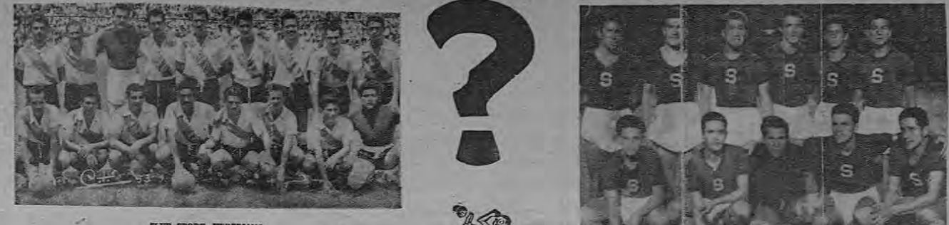
CLUB SPORT HEREDIANO