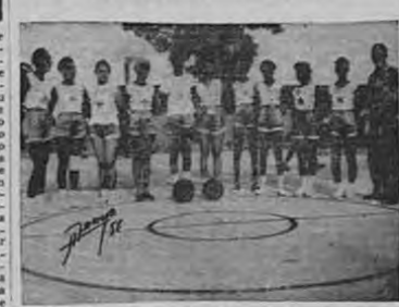
Compañía Bananera, campeón femenino de béisbol.

¡CAMPEONES! ¡CAMPEONES! ¡CAMPEONES! palabras que se pronunciarán varias veces con entusiasmo y alegría en los días que se leña acentúan a los días de competición. Más que una palabra: todo un título de jerarquía, conquistado en un duro terreno, enfrentando a adversarios de respetable potencia, en partidos porfiados de emoción y calidad. Donde los mejores se ven en acción, donde se juegan los puntos que a fin de cuentas adjudicará el árbitro. ¡CAMPEONES! ¡CAMPEONES! ¡CAMPEONES! Pero con honor, con abnegado esfuerzo. Los mejores por qué son los campeones.