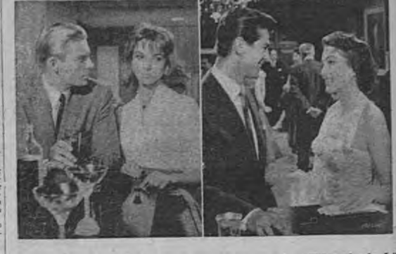
ELISA MARTINELLI, la nueva estrella italiana, en una escena con Grant Williams; derecha, Julia Adams envuete en una escena amorosa a George Nader.