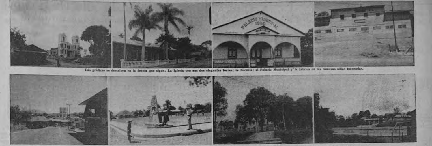
DE IZQUIERDA A DERECHA: LA ENTRADA A SARCHI, DESDE NARANJO; PLAZA DE DEPORTES Y MONUMENTO; EL PARQUE FRENTE A LA IGLESIA; UN AMPLIO BENEFICIO DE CAFE...