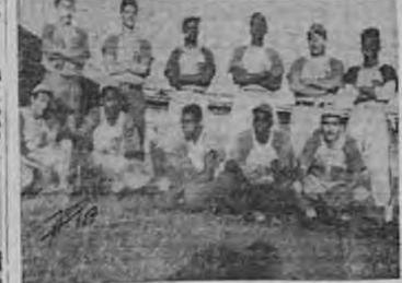
La Barra, campeón masculino de fútbol.