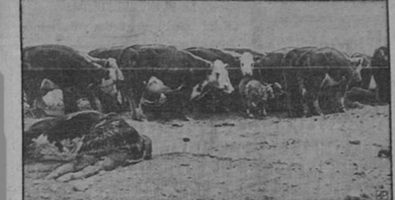
Cabezas de ganado Hereford con incrustaciones de nieve en la región de Están, Estado de Nuevo México, se arrojan a la cerca de una finca a raíz de la tormenta de nieve que barre la región...

—LA ELEVA ANTE EL MINISTRO DE GOBERNACION LA "ASOCIACION DE IMPORTADORES DE ARTEFACTOS ELECTRICOS DE ESTA PLAZA"