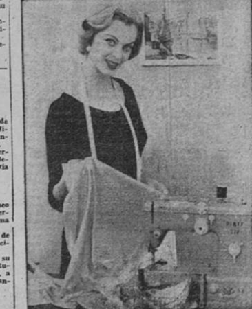
PFaff Sewing Institute

Usted puede darle nueva vida a sus antiguas frazadas, unirse el Instituto de Costura Pfaff simplemente poniéndolas en ribete e haciendo sobre la base de cuatro vueltas el largo de la frizada más o menos pulgada. Corte la tela a lo ancho. Cúala los bordes formando una bolsa, por dentro así. Doble hacia adentro los bordes sin terminar insertando un cierre elástico. Si usted quiere darle un efecto elegante, añada en aplicación un monograma en el centro. Con la ayuda de su máquina Pfaff se evita el aburrido trabajo en doblar los bordes sin terminar de las partes de sus piezas, pues bastará con darle puntadas satin sobre ellas. Ponga dentro de las frazadas (tanto de tela) el tamaño de la frizada. Para que no se corran. Finalmente, usted puede hacer frazadas para las cunas y camas de sus niños; para eso, elimine las partes excesivamente usadas de sus viejas frazadas y póngalas en ribete de género de algodón o color pastel. Si el color de la frizada es muy oscuro, simplemente cubra un lado con un género de color y diseño alegre, cortándolo unos diez centímetros más allá del tamaño de la frizada. Doble este sobrante hacia el otro lado de la frizada y cózalo con una puntada simple, o utilizando el doblado Pfaff. Para eso necesitará 36-24 g de su Pfaff.