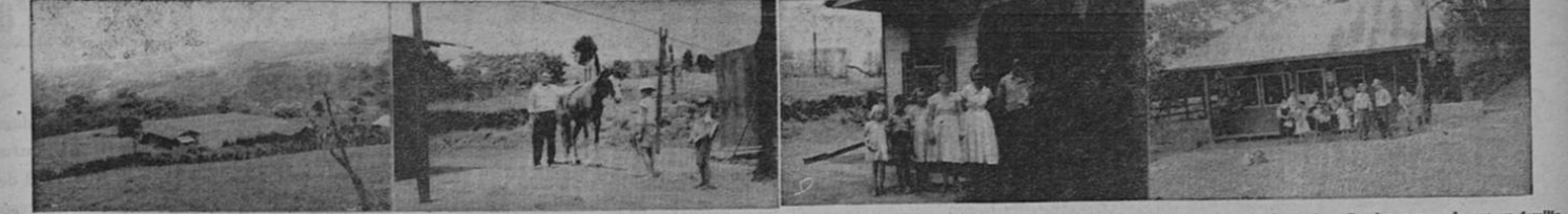
Por su arte, las fotos se describen así: loto donde se edificará la nueva iglesia, con una preciosa vista al fondo; el anterior mente citado don José Gómez, con su magnifico caballo peruano valorado en más de dos mil colones; posando con su familia, el mismo ciudadano. Finalmente: la pulpería y taquilla de don Fabio Rodríguez.