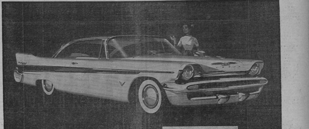
De Soto 1957 — Con Motores desde 130 hasta 320 Caballos de Fuerza - Sencillamente Sensacional

No compre auto nuevo sin ver el novísimo De-Soto 1957.