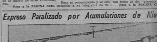
Enormes montones de nieve producto de la peor tormenta que había asolado a las Grandes Llanuras desde el año de 1871 detuvieron al expreso del Unión Pacific Railroad "City of St. Louis"...